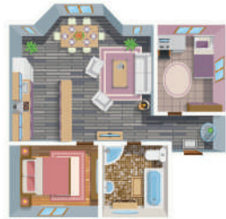
КВАРТИРА (ЧАСТЬ КВАРТИРЫ, КОМНАТА)