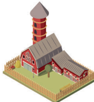
ЕДИНЫЙ НЕДВИЖИМЫЙ КОМПЛЕКС