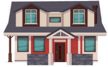
ЖИЛОЙ ДОМ (ЧАСТЬ ЖИЛОГО ДОМА)