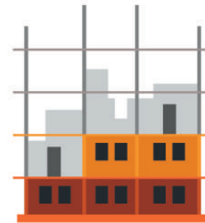
ОБЪЕКТ НЕЗАВЕРШЕННОГО СТРОИТЕЛЬСТВА