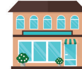
ИНЫЕ ЗДАНИЕ, СТРОЕНИЕ, СООРУЖЕНИЕ