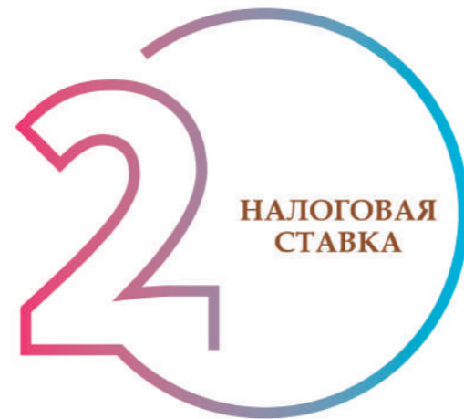
ШАГ 2. ОПРЕДЕЛЕНИЕ НАЛОГОВОЙ СТАВКИ