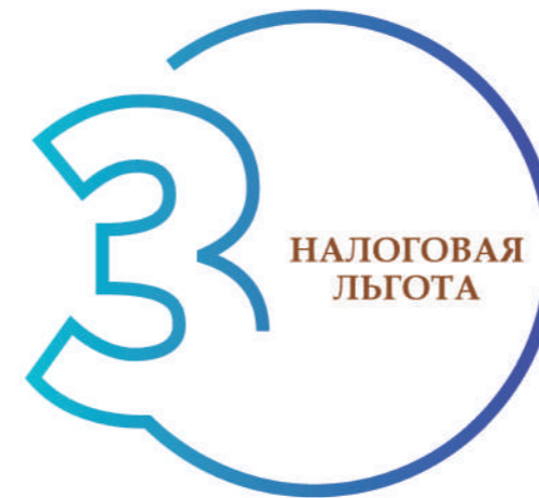
ШАГ 3. ОПРЕДЕЛЕНИЕ НАЛОГОВОЙ ЛЬГОТЫ