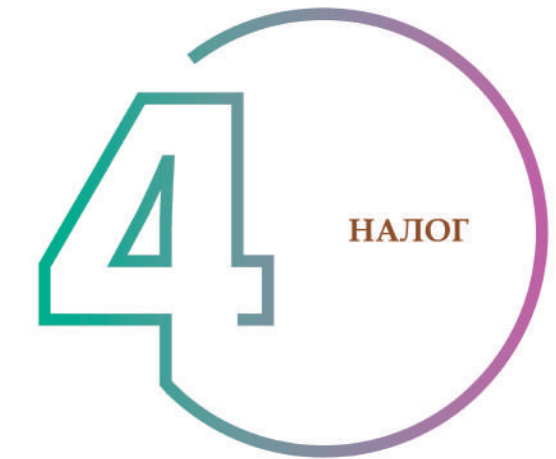
ШАГ 4. РАСЧЕТ НАЛОГА