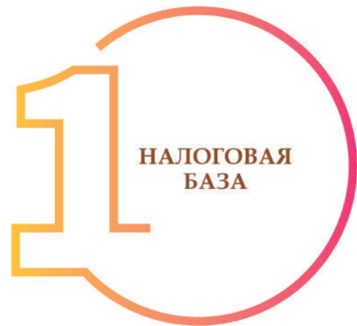
ШАГ 1. ОПРЕДЕЛЕНИЕ НАЛОГОВОЙ БАЗЫ