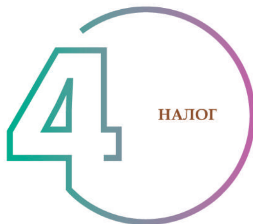
ШАГ 4. РАСЧЕТ НАЛОГА